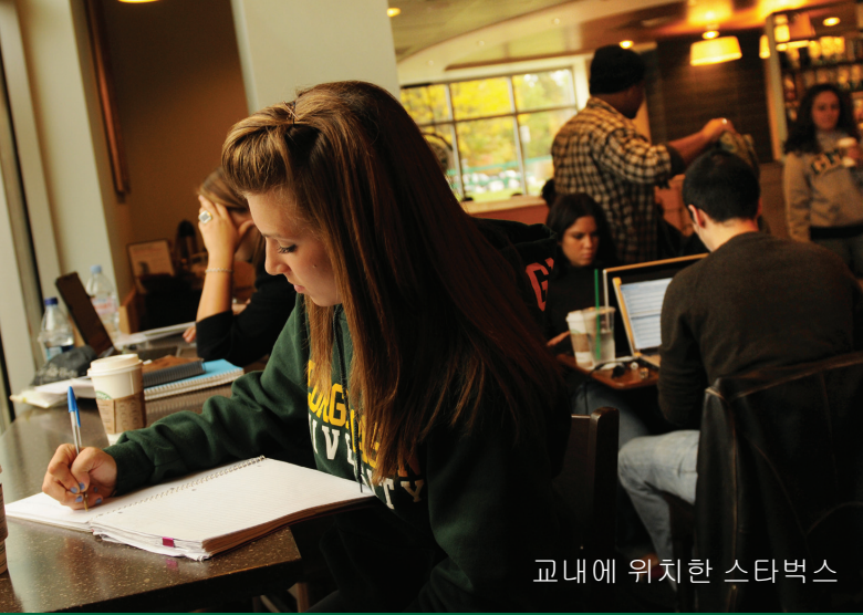
교내에 위치한 스타벅스