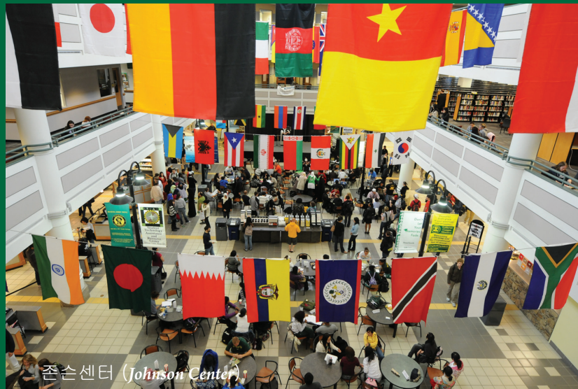
존슨센터 (Johnson Center)