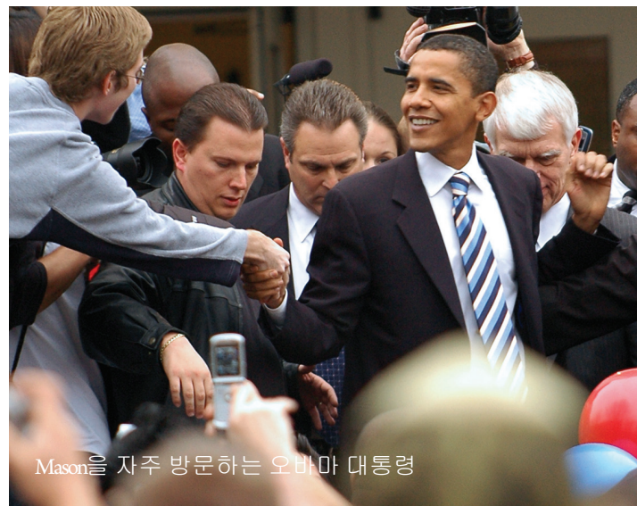
Mason을 자주 방문하는 오바마 대통령