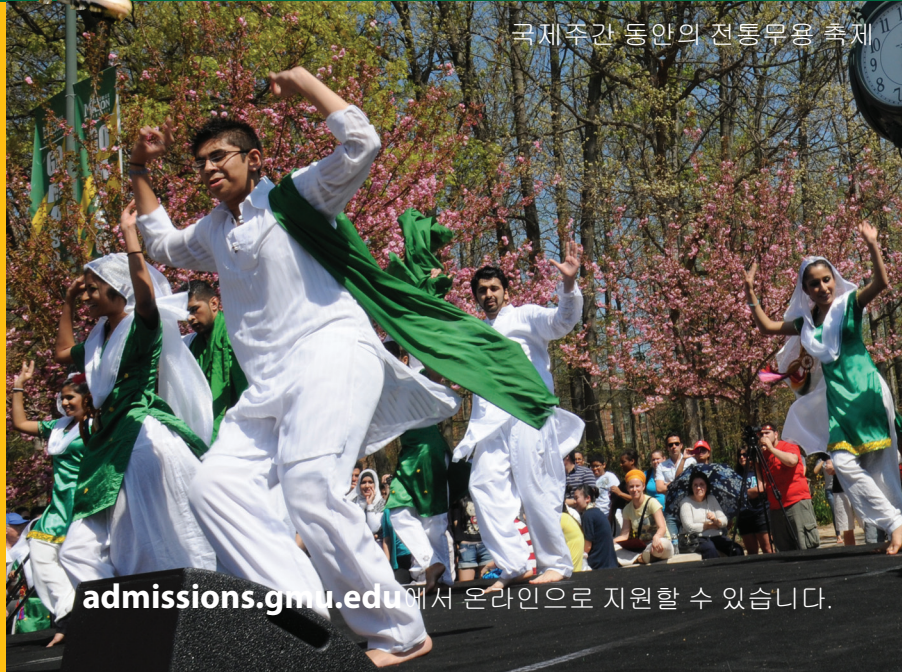
국제주간 동안의 전통무용 축제