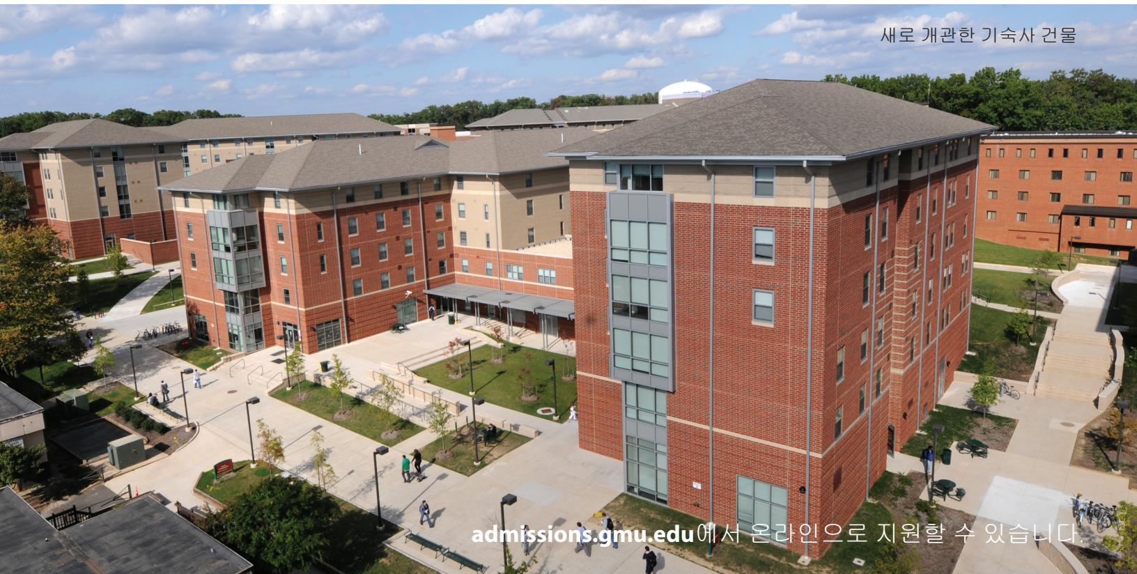
새로 개관한 기숙사 건물

7,000명에 달하는 재학생들이 현대적인 최첨단 기숙사에서 자신의 집처럼 편안하게 생활하고 있습니다. 기숙사생의 규모는 계속 늘어나고 있습니다. 교내에 거주하면 수업 공간과 가까운 위치에서 보다 안전하고 편리하게 생활할 수 있습니다.