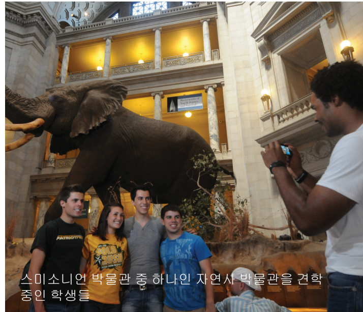
스미소니언 박물관 중 하나인 자연사 박물관을 견학 중인 학생들