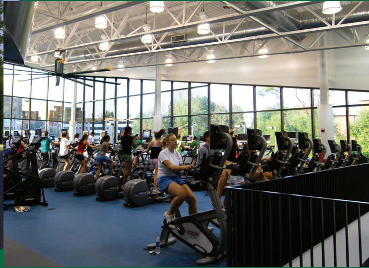
본교의 3개 교내 피트니스 센터 중 하나인 수중 스포츠 및 피트니스 센터(Aquatic and Fitness Center)에는 2개의 실내 수영장과 다층식 구조에서 각종 운동시설을 갖춘 체육관이 있습니다.