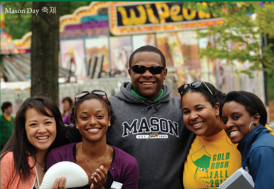
Mason Day 축제