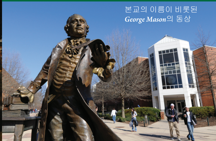
본교의 이름이 비롯된 George Mason의 동상