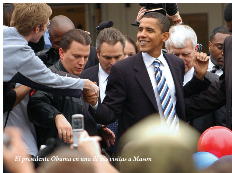
El presidente Obama en una de sus visitas a Mason