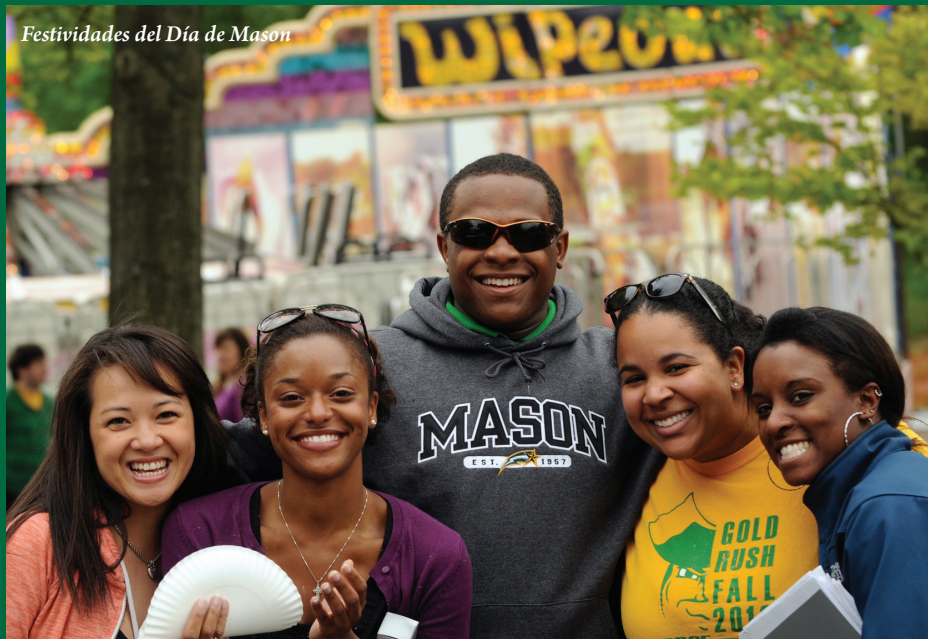
Festividades del Día de Mason