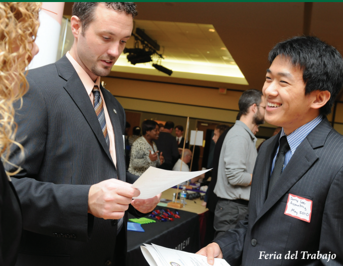
Feria del Trabajo