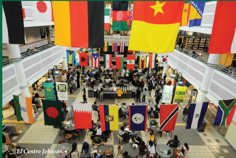
El Centro Johnson