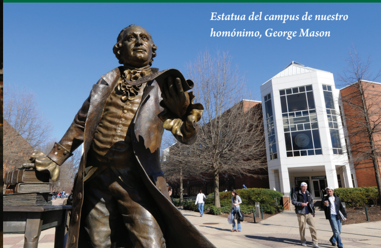
Estatua del campus de nuestro homónimo, George Mason