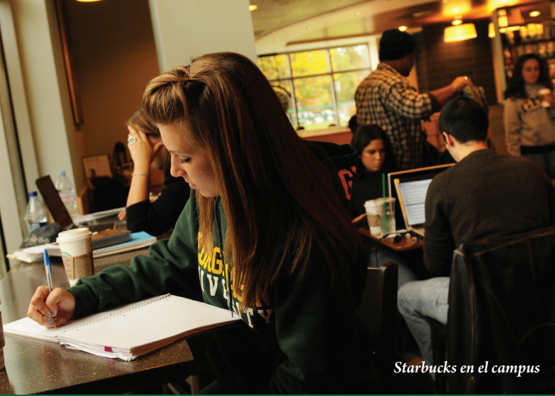
Starbucks en el campus