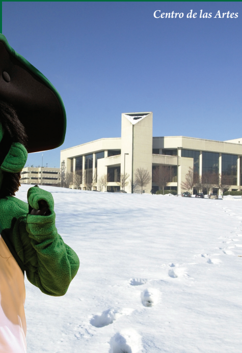
Centro de las Artes