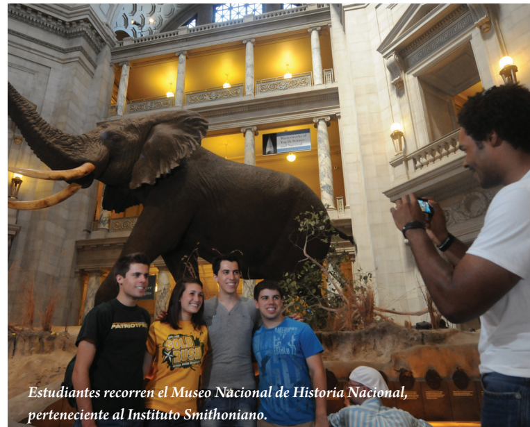
Estudiantes recorren el Museo Nacional de Historia Nacional, perteneciente al Instituto Smithoniano.