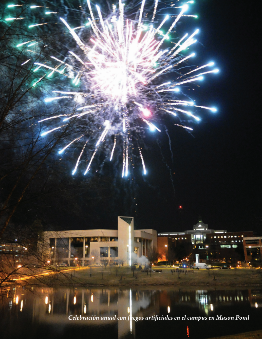
Celebración anual con fuegos artificiales en el campus en Mason Pond