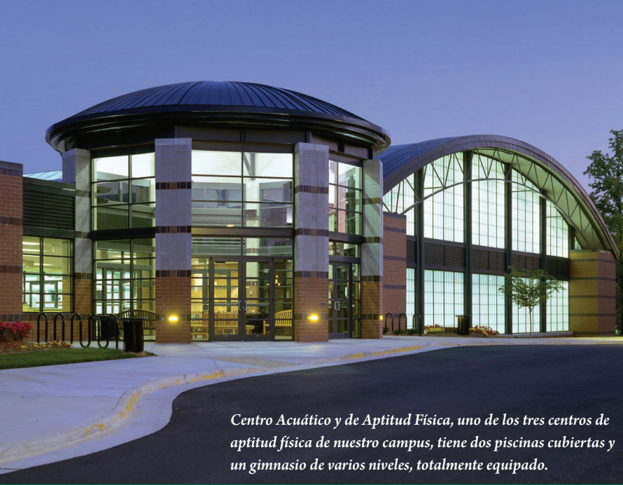
Centro Acuático y de Aptitud Física, uno de los tres centros de aptitud física de nuestro campus, tiene dos piscinas cubiertas y un gimnasio de varios niveles, totalmente equipado.